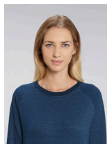
Stella Tripster Denim